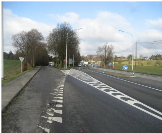
Sortie du site