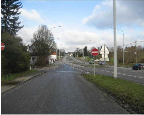
Entrée du site