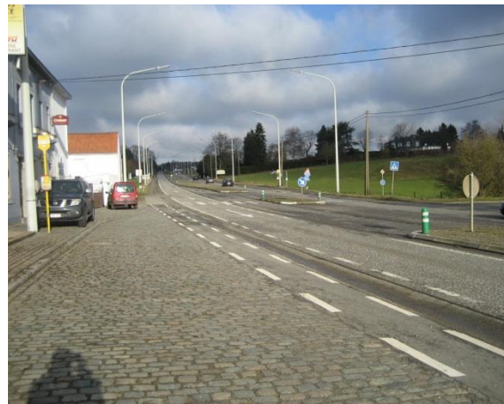
Arrêts TEC sur la N5 en amont du site