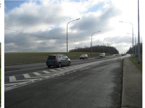
Sortie du site