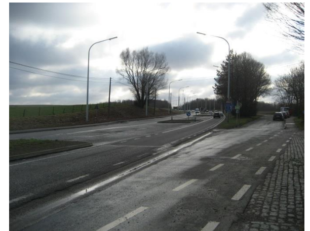
Tourne à gauche permettant l'entrée sur le site