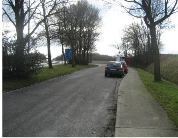
Site avec piste cyclable longeant le stationnement