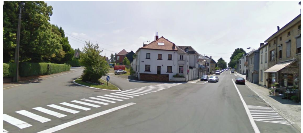
Carrefour avec la rue de Villers-la-Ville :