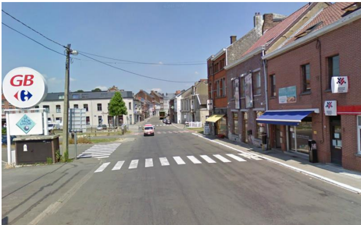
Chaussée de Charleroi :

Entrée de ville par la Chaussée de Charleroi vers le centre de Genappe, où la vitesse est mal maîtrisée et comprenant des cheminements piétons très peu confortables alors qu'on se situe au niveau du pôle RAVeL et sur la partie sud de l'axe commerçant.